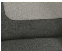
+ Wohnwelt Calypso inkl. Fahrer- und Beifahrer-Sitzbezug ○