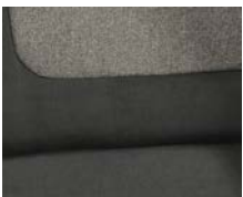
+ Wohnwelt Ravello