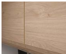
+ Möbeldekor Noce Nagano