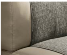
+ Wohnwelt Camino